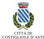
illustrazione di RICCARDO GUASCO progetto grafico SIXELEVEN

info@piemontedalvivo.it piemontedalvivo.it